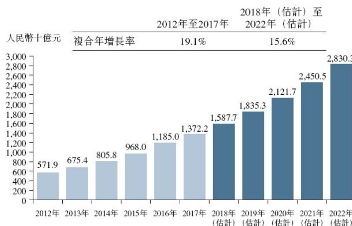
2012年至2022年（估計）中國人力資源服務市場的市場規模

人力資源服務行業的急速發展亦有賴中國政府實施的一系列有利政策，例如《國家中長期人才發展規劃綱要（2010 年至 2020 年）》優先推行人才發展及發展人才服務行業。中國人力資源服務市場錄得增長，由 2012 年約人民幣 5,719 億元增至 2017 年人民幣 13,722 億元，複合年增長率為約 19.1%。預期中國人力資源服務行業將經歷可觀增長，由 2018 年約人民幣 15,877 億元增至 2022 年人民幣 28,303 億元，複合年增長率為約 15.6%，一線城市的高僱員流失率將支持人力資源服務市場的擴充，支柱行業（高科技、金融服務、現代物流及文化界別）的預計強勁增長將帶動經濟持續發展。