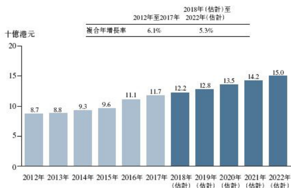
2012年至2022年（估計） 香港人力資源服務市場的市場規模

香港整體人力資源服務行業的市場規模由 2012 年約 87 億港元增長至 2016 年 111 億港元，複合年增長率為約 6.3%，主要受調派及支薪服務及其他人力資源服務的強勁增長帶動。鑒於香港的未來經濟及相關人力資源活動的前景樂觀，市場規模預期將於 2022 年達到約 150 億港元，複合年增長率為約 5.3%。