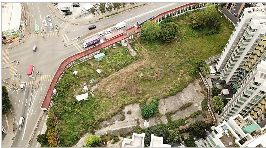
元朗 – 十八鄉路