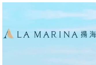
LA MARINA 揚海 黃竹坑 第三季即將推出